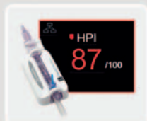
Acumen IQ Sensor mit Acumen Hypotension Prediction Index Software

Mit einer Technologie, die für das individuelle Patientenmanagement auf der HemoSphere Plattform entwickelt wurde