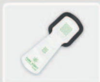
ForeSight Elite Gewebe- Oximetriesystem